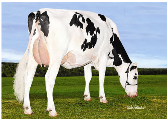
PIGNONS-BLEUS NOEMIE POLICE