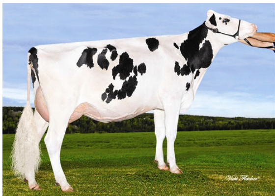
PIGNONS-BLEUS NOEMIE POLICE